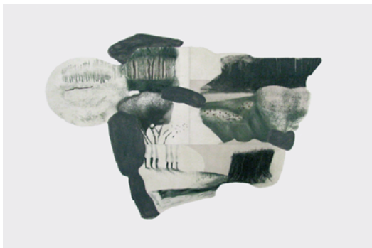
LOCATIE: SJÖFALLE, ZWEDEN Landschap - 118 x 78 cm Geuren - Reeks van 4 - 16 x 29 cm