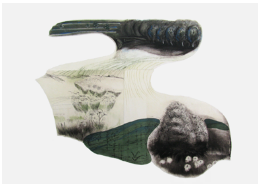
LOCATIE: HABERGY, WALLONIË (ZUID-BELGIË) Tussenheuvels - 98 x 78 cm Wilde bloemen - Reeks van 6, 16 x 29 cm